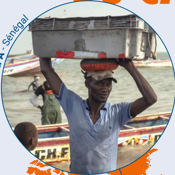
ADEPA - Sénégal