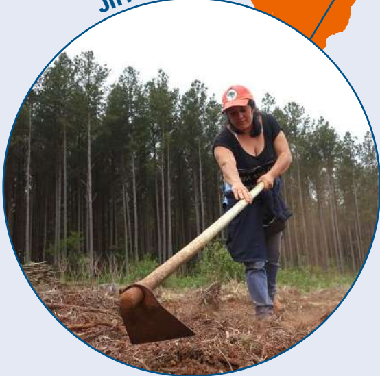
JnT - Brésil