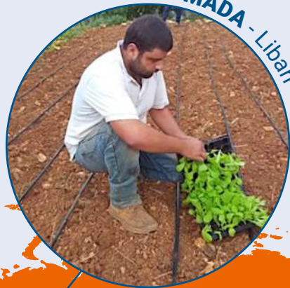
MADA - Liban