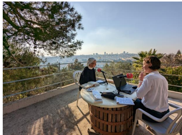
Interviews à Jérusalem par Véronique Alzieu et Madeleine Vatel @ RCF