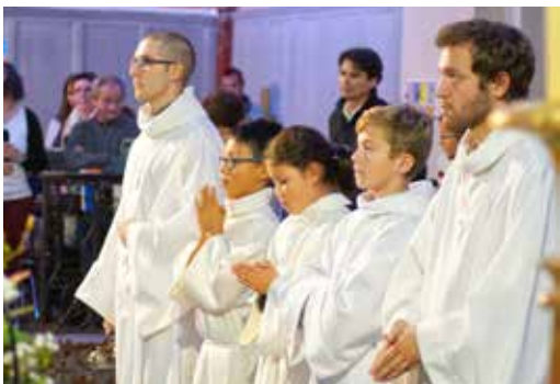
Messe d'Accueil Bages, 18 Novembre 2017