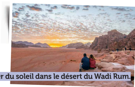
Lever du soleil dans le désert du Wadi Rum.

Très tôt le matin, pour ceux qui le souhaitent, possibilité d'assister au magnifique lever du soleil.