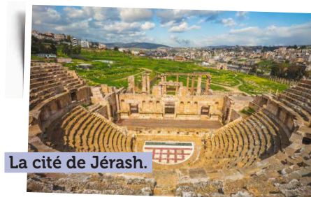
La cité de Jérash.

Le matin, route vers Anjara , vers le sanctuaire de Notre-Dame du Mont : lieu de pèlerinage important en Jordanie, visité par Jean Paul II en 2000. La mémoire a transmis cette dévotion particulière à la Vierge Marie, en ce lieu où Jésus et sa mère se seraient arrêtés alors qu'ils cheminaient dans la Décapole. En 2010, des larmes de sang qui ont coulé des yeux de la Vierge ont fait connaître encore davantage le sanctuaire.