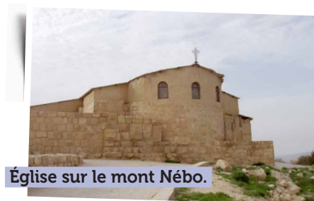
Église sur le mont Nébo.