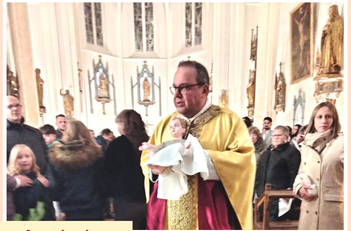
Messe de minuit en l'église Saint-Martin de ROQUEFORT.