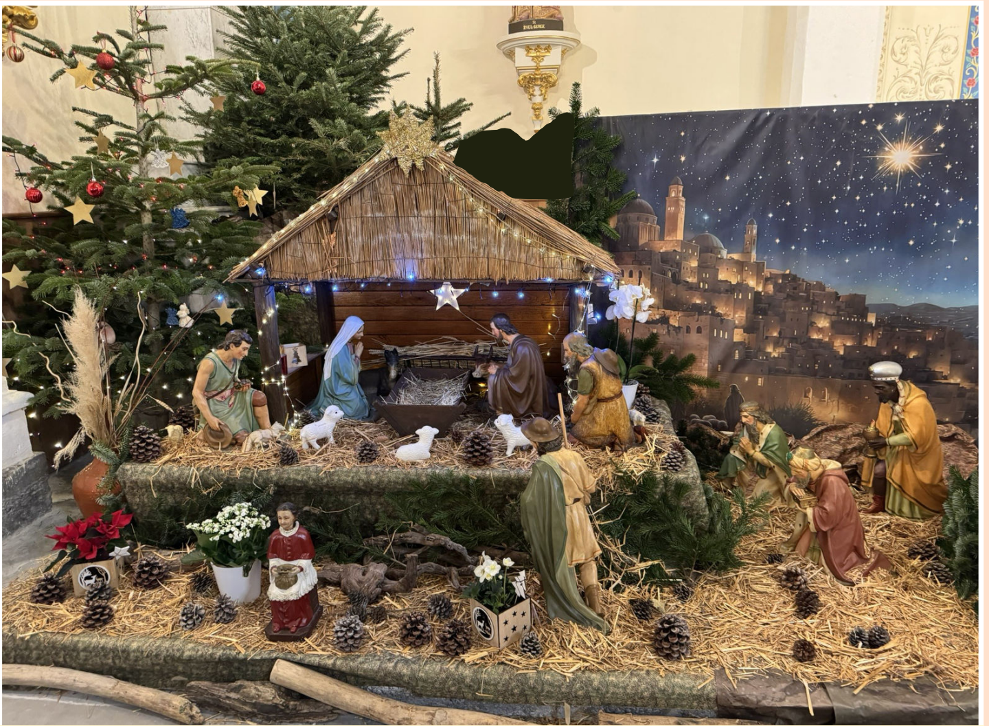
La crèche et la messe de la nuit à PORT-LA NOUVELLE