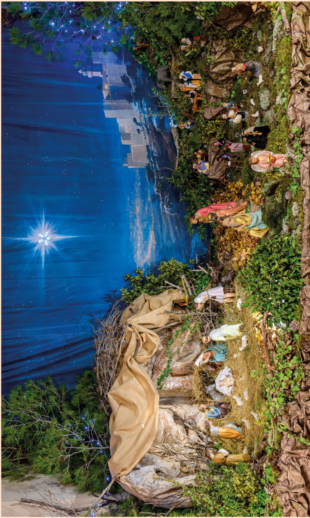
La grande crèche de l'église de SIGEAN: Cette grande fresque de la Nativité, large de plus de 8m a été réalisée au pied d'une toile de fond de 6m sur 3, recréant un paysage nocturne de Palestine orné du village fortifié de Bethléem et couronné d'une grande étoile scintillante. L'étable a été improvisée dans le creux d'un rocher, abritée de branchages et protégée par une toile de jute. Les lumières, tantôt bleues, tantôt jaunes créent un climat mystérieux qui accentue le réalisme de la scène. Félicitations à toute l'équipe qui a travaillé à cette réalisation !