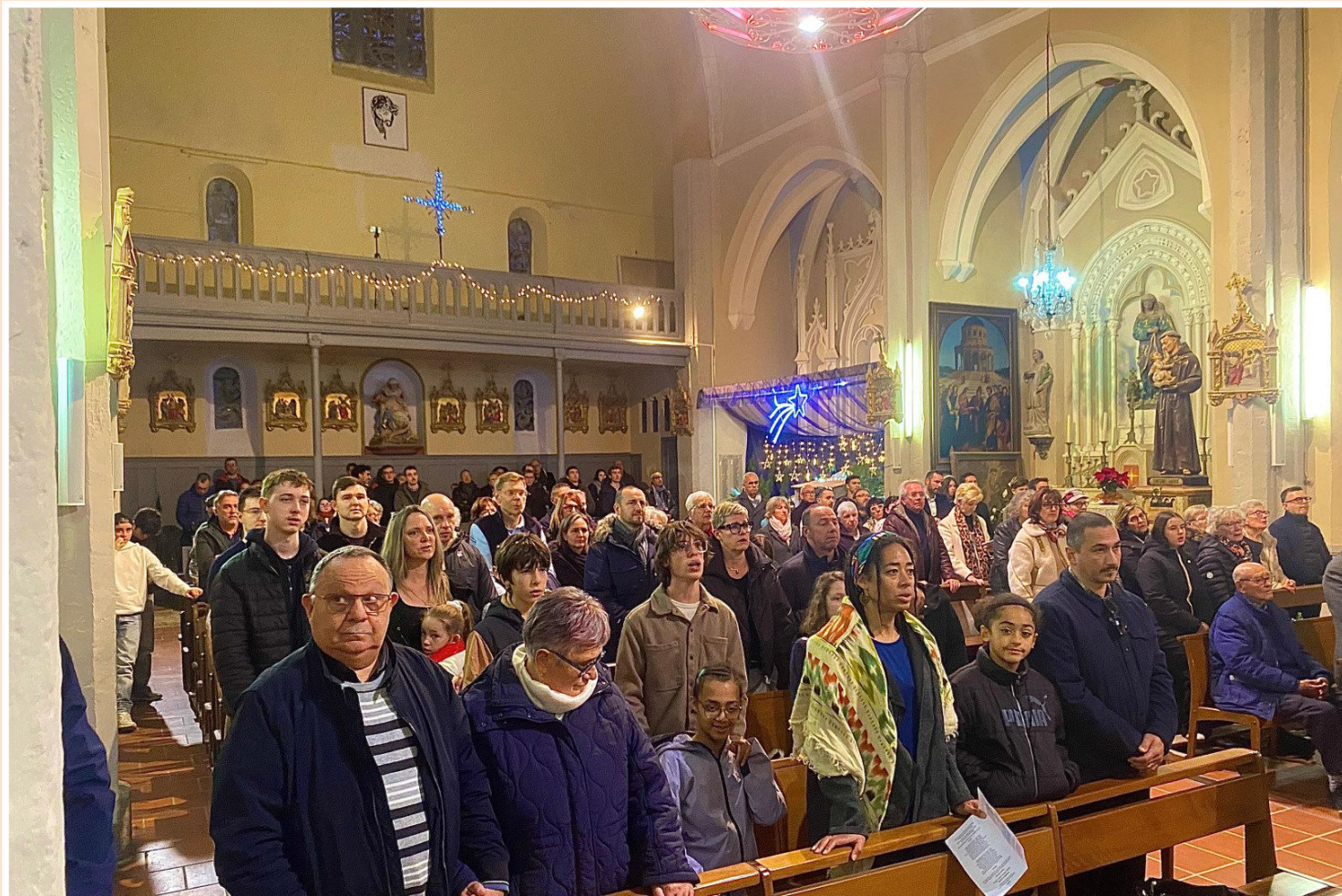
Les messes de la nuit de NOËL à LA PALME (en haut) et à LEUCATE-village (en bas)