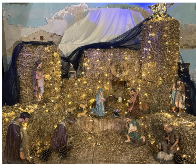
La crèche en paille de LEUCATE-village.