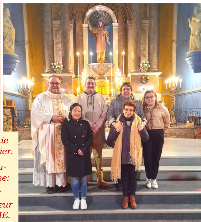
Inauguration du chœur de l'église. LA PALME.