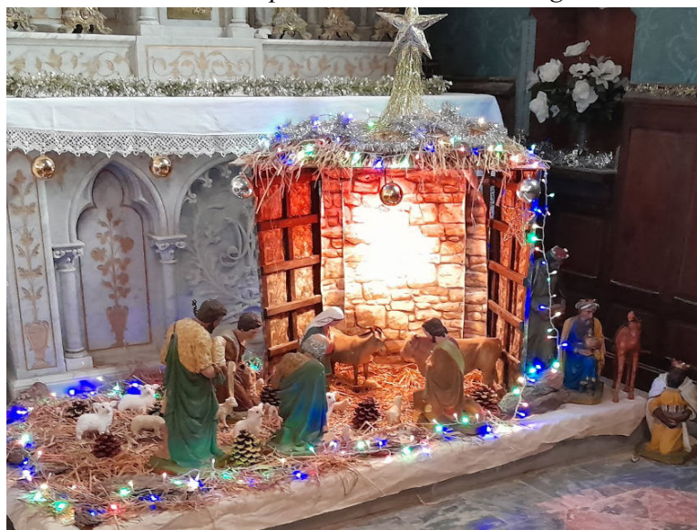
La crèche de BAGES dans la chapelle de la Ste Vierge.