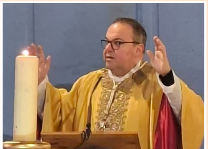
La messe du Jour de Noël à SIGEAN.