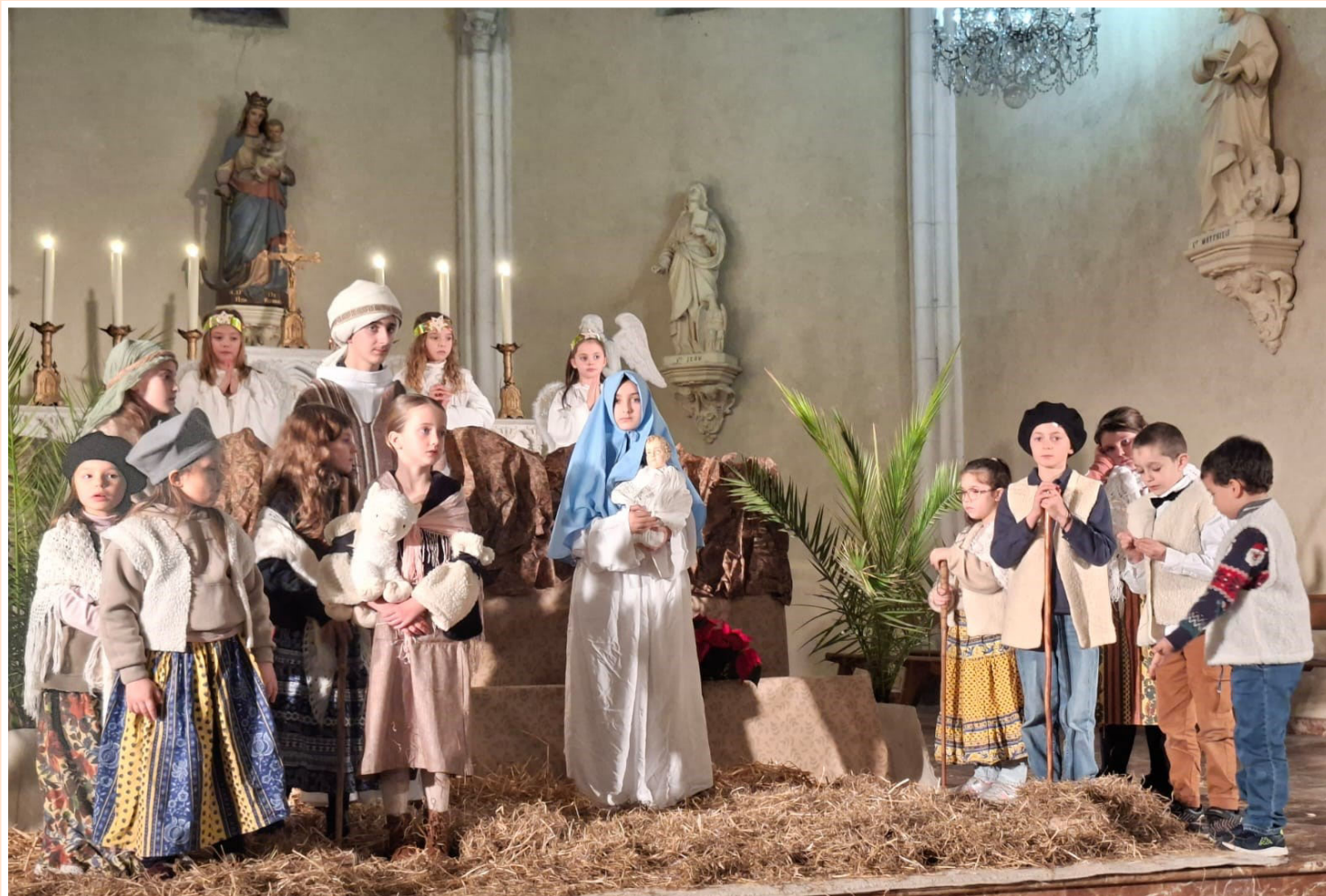
Le tableau principal de la Crèche Vivante et la messe de la Nativité à PORT-LA NOUVELLE.