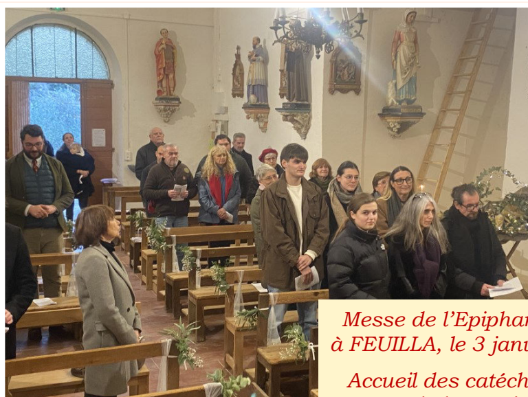
Messe de l'Epiphanie à FEUILLA, le 3 janvier.