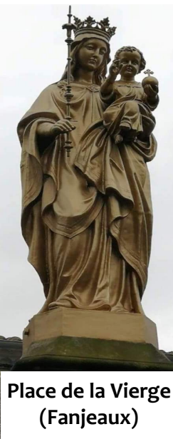
Place de la Vierge (Fanjeaux)