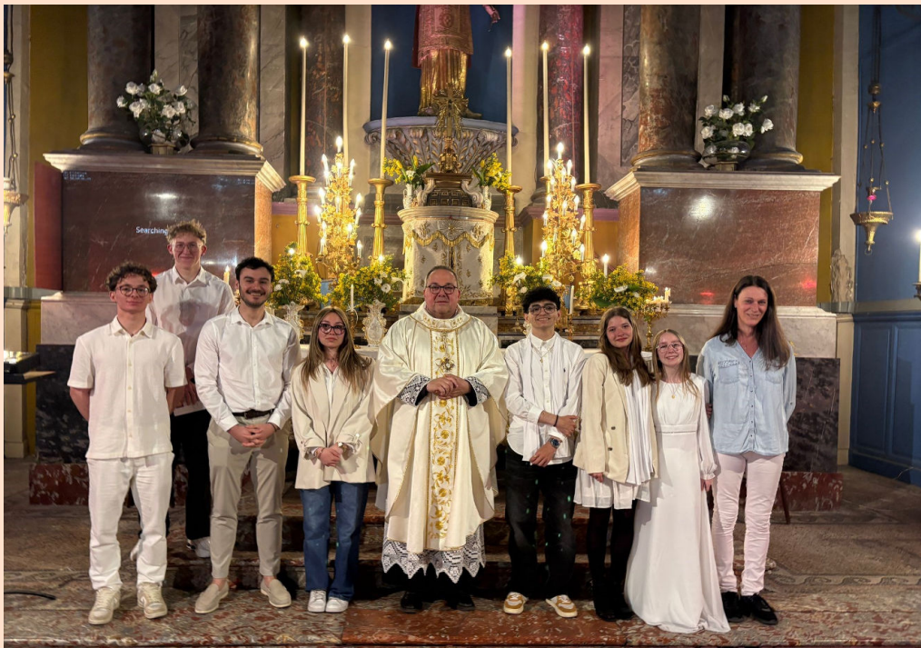
Les baptisés et les communiantes adultes et adolescents de la nuit de Pâques