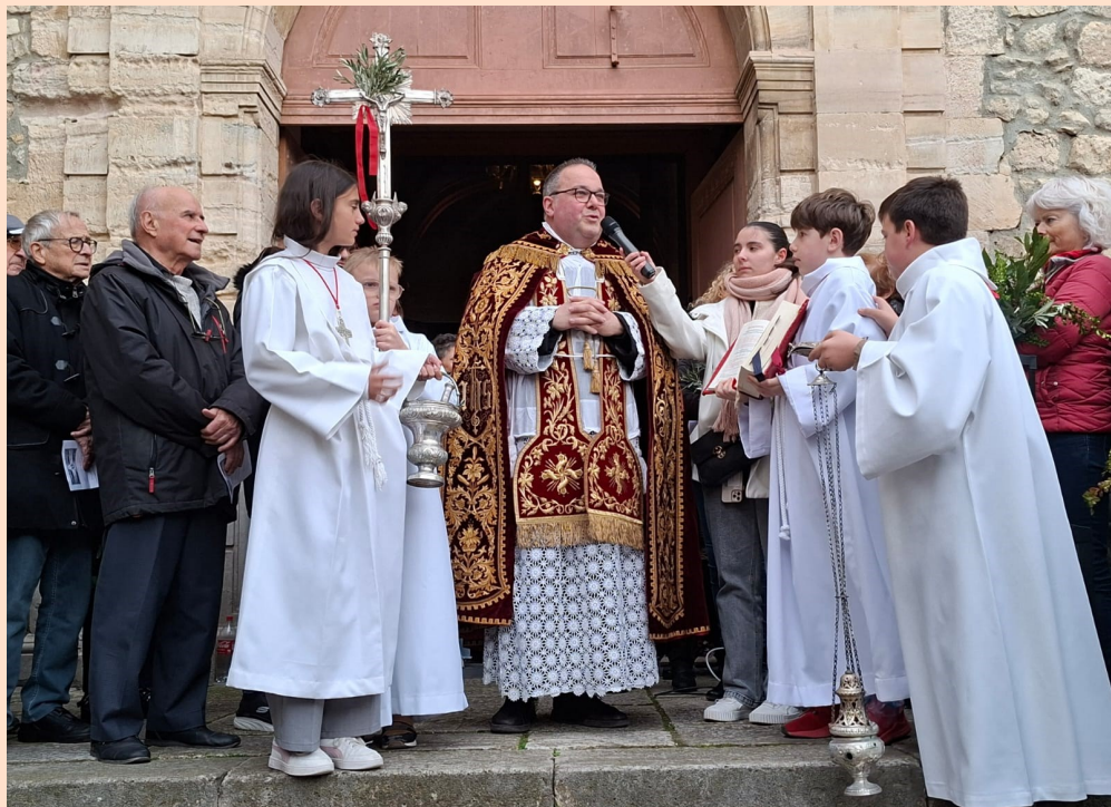
La messe des Rameaux et de la Passion à SIGEAN le 28 mars.