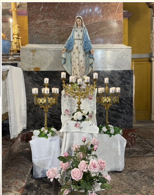
Mois de Marie à Sigean...