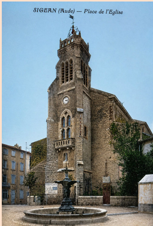
SIGEAN (Aude) — Place de l'Eglise

Grâce à l'IA, ces photos de l'église de Sigean ont pu être mises en couleur. 40 années les séparent ! La première, de 1887, montre l'état avant la construction du clocher. Sur la seconde, de 1927, on aperçoit toujours la fontaine au centre de la place avec le clocher actuel. Ci-dessous : plan de l'église avec les patronymes des chapelles au XIXe S.