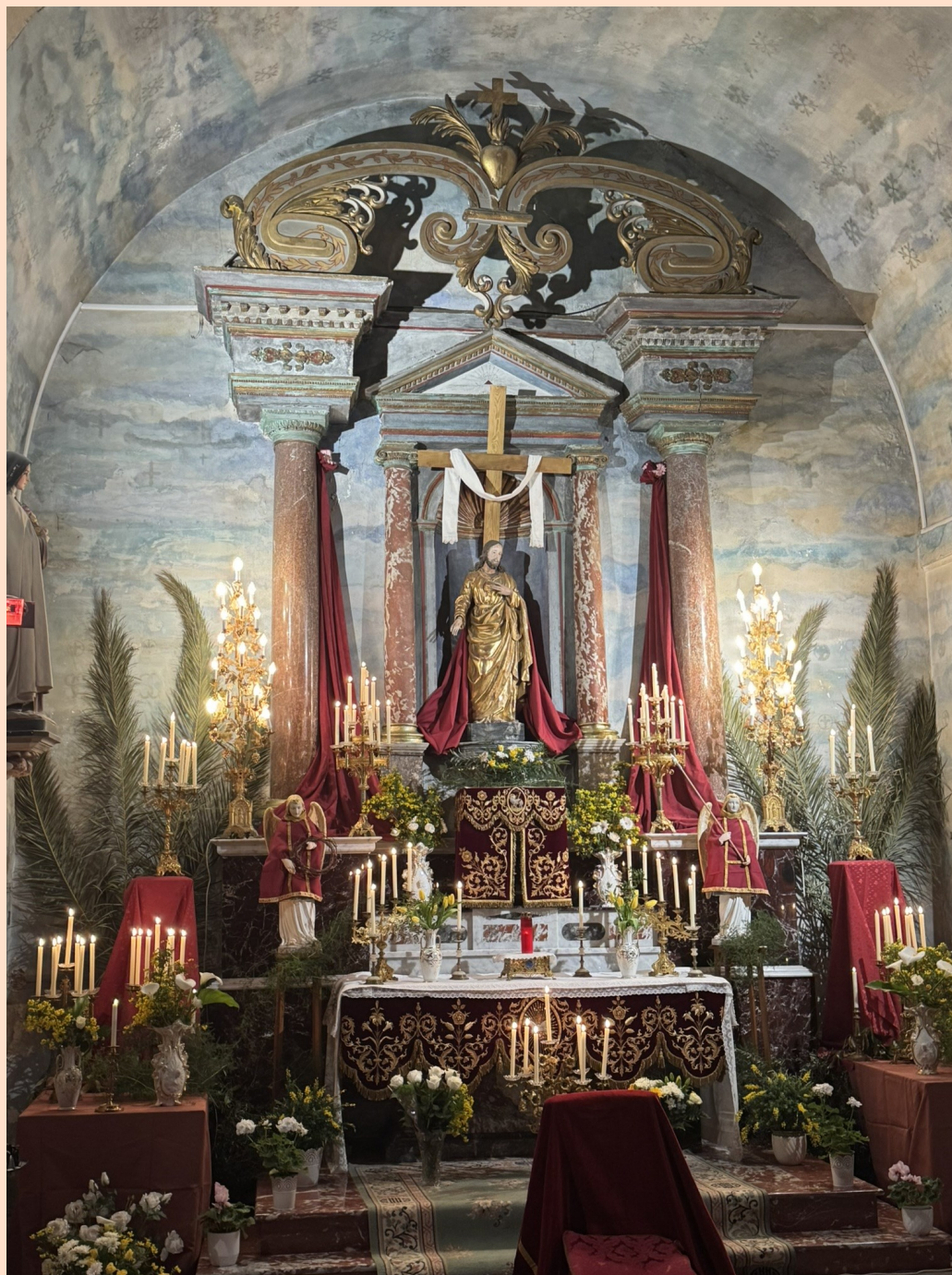
Le reposoir du Jeudi Saint disposé dans la chapelle du Sacré-Cœur à SIGEAN a servi de cadre à la veillée de prière puis à la prière silencieuse....