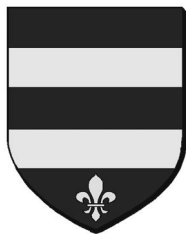
Ancien blason de Sigean.

Même s'il n'existe plus aujourd'hui, ce clocher original, intégré aux remparts, fut militarisé sous l'impulsion de l'archevêque de Narbonne de 1375 à 1391, Jean-Roger de Beaufort qui eut à cœur de construire les fortifications de l'agglomération. Par ailleurs, les armoiries de ce dernier figurèrent un temps sur les murs constituant le clocher, elles ont depuis disparu. (à suivre)