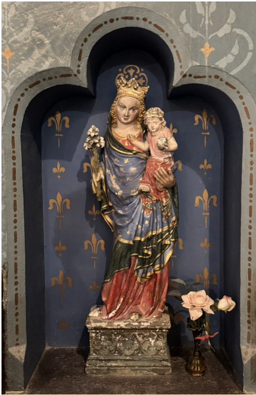
Vierge à l'Enfant, église de BAGES.