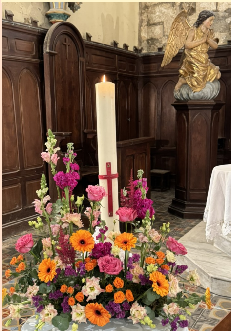
Bouquet pascal à Bages....